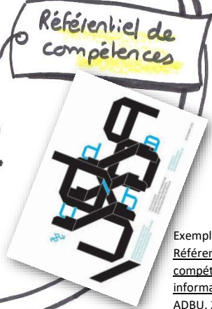
Exemple utilisé ici : Référentiel des compétences informationnelles , ADBU, 2012